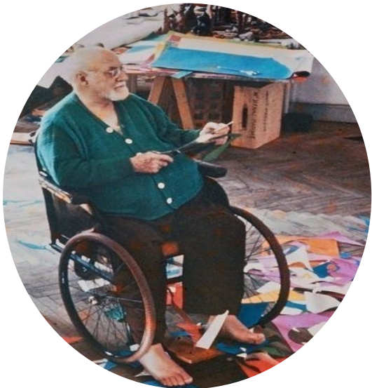
Créer malgré tout