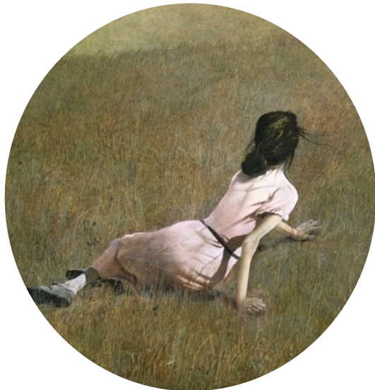
Représenter la différence

Selon vos besoins, ces deux thématiques peuvent... ... faire l'objet de deux conférences distinctes ... être fusionnées en une seule conférence